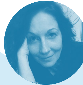
Chus Sánchez Comunicación